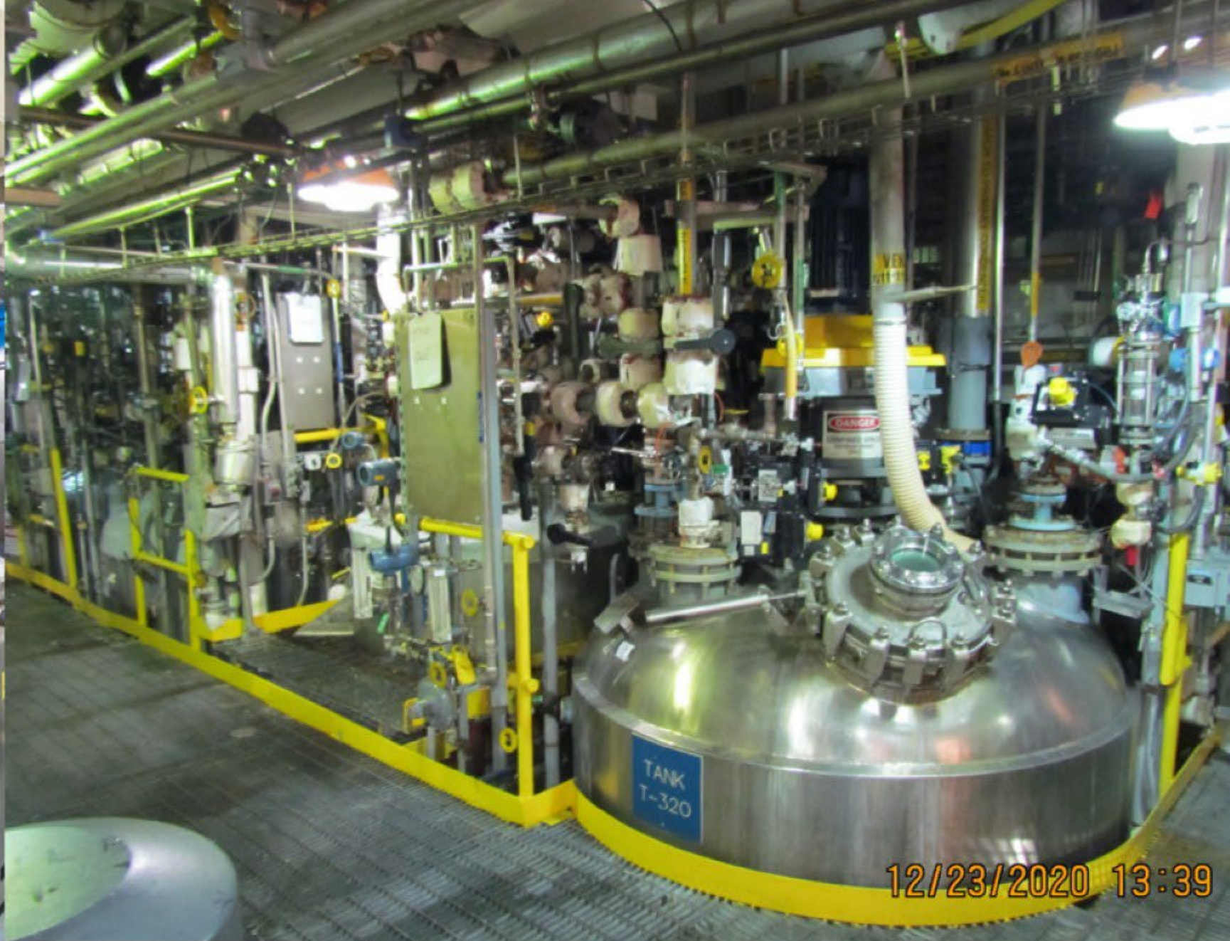
Laboratorio de fentanilo de calidad médica