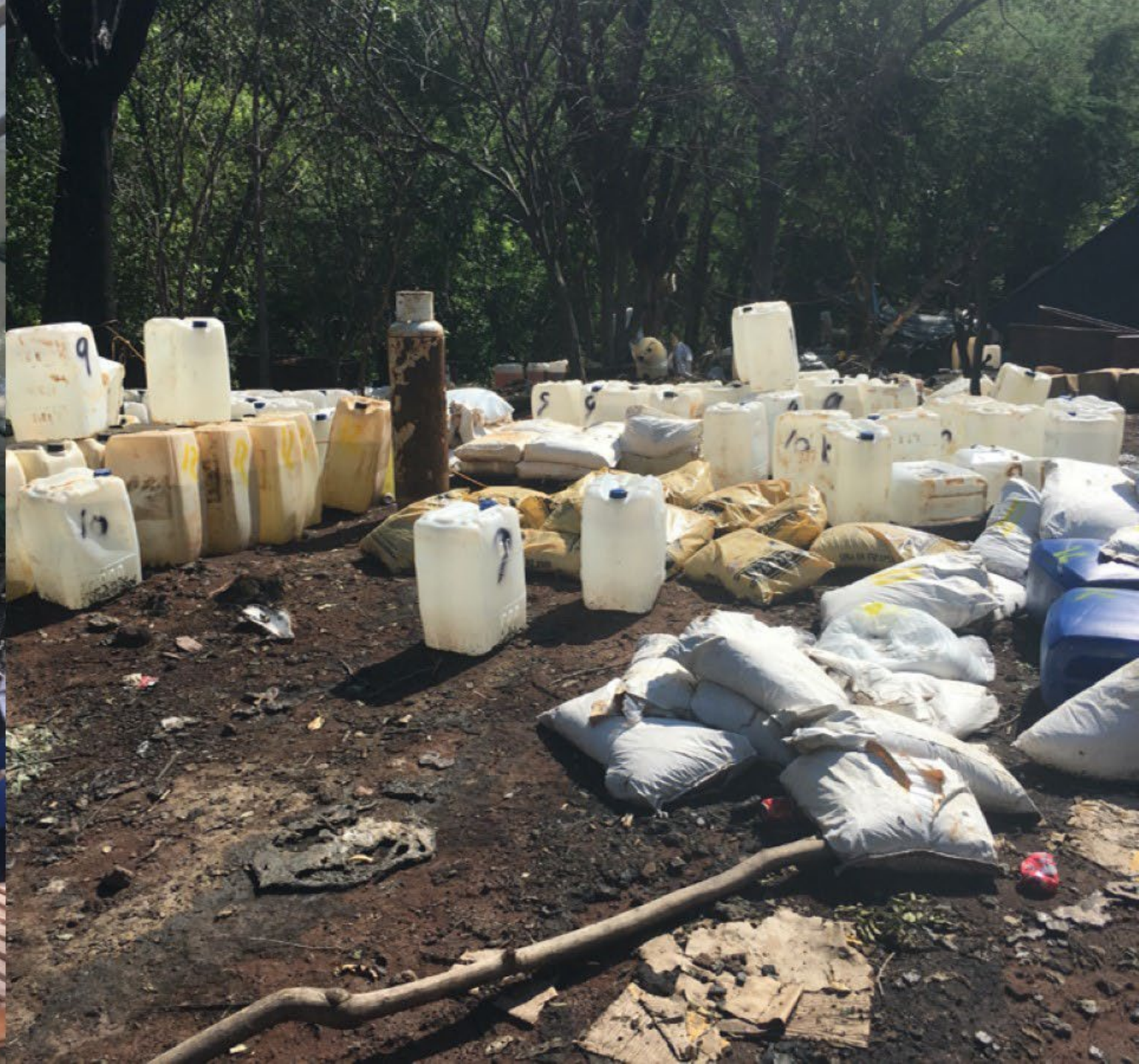
Laboratorio ilegal de fentanilo